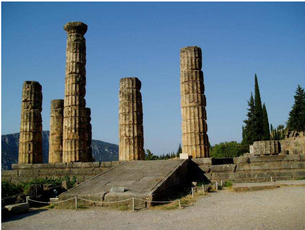
Delfi: tempio di Apollo, colonne del pronao

Posti limitati: mascherina obbligatoria. Possibilità di prenotazione scrivendo a segr.sbt@ti.ch