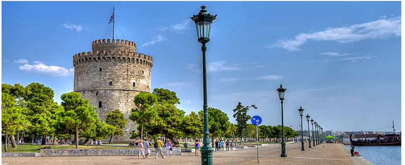
Salonicco - Rotonda di Aghios Georghios.

Partenza da Milano-Malpensa alle ore 11.00 (volo di linea Aegean Airlines), con scalo ad Atene e arrivo a Salonicco alle alle ore 16.10. Prima panoramica orientativa della città. Cena e pernottamento a Salonicco.