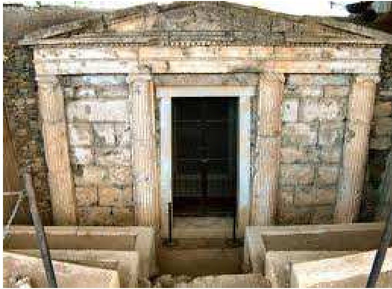
Tomba di Filippo II a Verghina

Rientro a Salonicco e visita della Rotonda di Aghios Georghios. Cena e pernottamento a Salonicco.