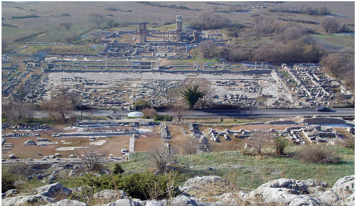
Area archeologica di Filippi