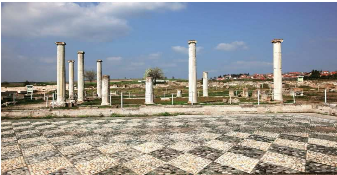
Foro di Pella

Proseguimento per Pella , una delle capitali antiche della Macedonia, città natale di Alessandro Magno. Dopo pranzo visita dell'area archeologica e del museo annesso.