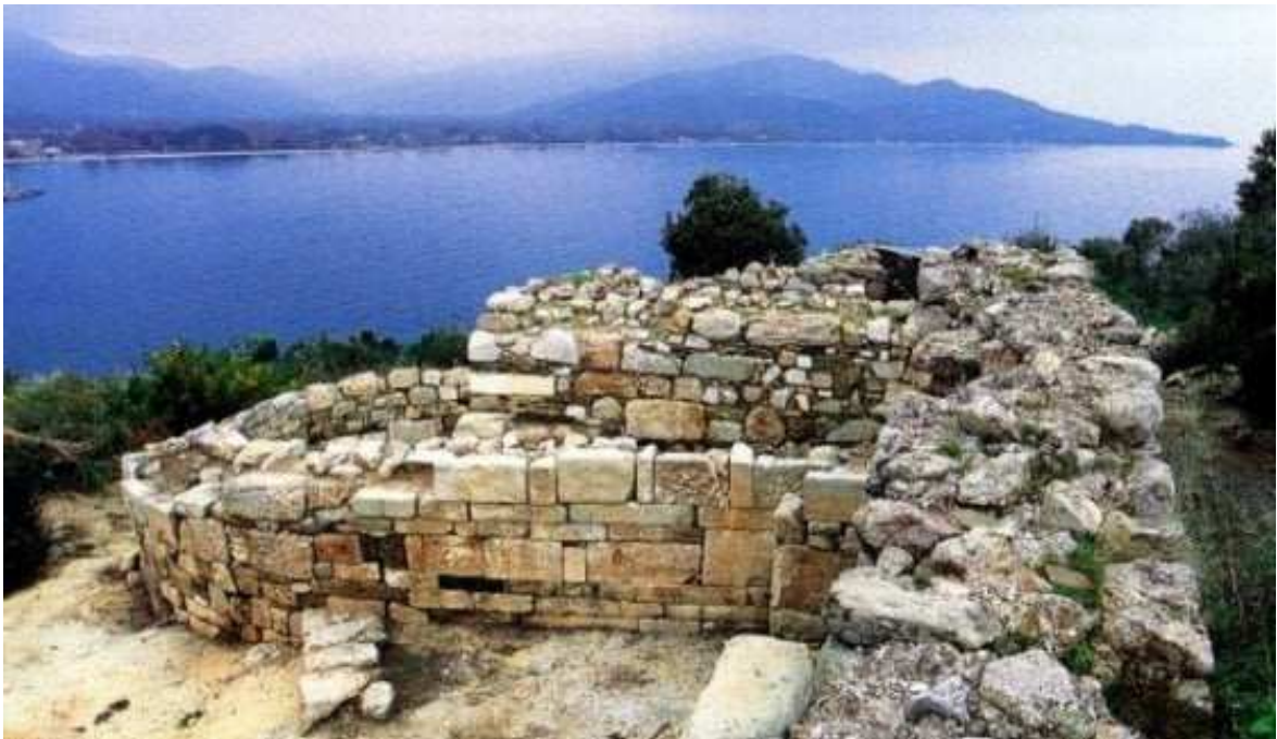
Area archeologica di Stagira (particolare)

Trasferimento, al mattino presto, a Stagira , città natale di Aristotele; visita dell'area archeologica che si affaccia sul mare con uno splendido scenario.