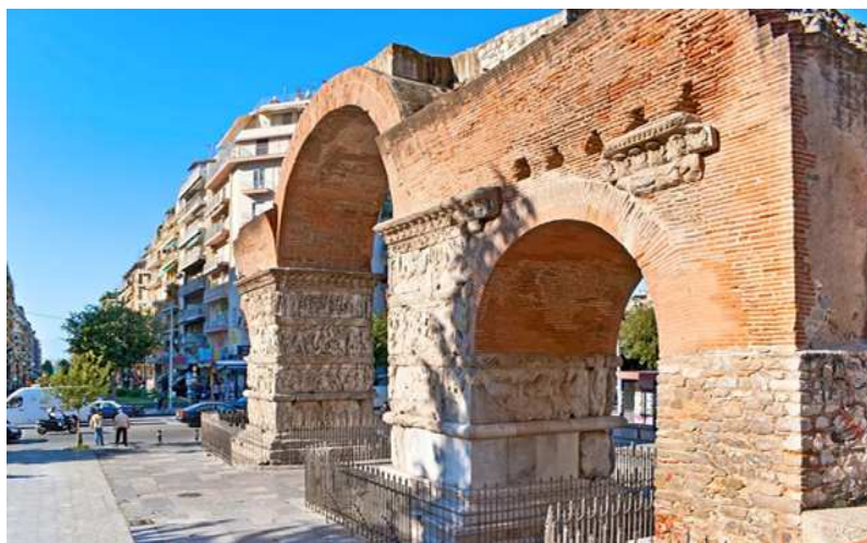
Arco di Galerio

Giornata dedicata alla visita a piedi di Salonicco , seconda città della Grecia per importanza artistica e finanziaria. In mattinata visita ai resti della città romana (Palazzo di Galerio, Arco di Galerio, Agorà romana). Nel pomeriggio visita al Museo Archeologico; a seconda del tempo a disposizione, visita al Museo Bizantino. Cena e pernottamento a Salonicco.