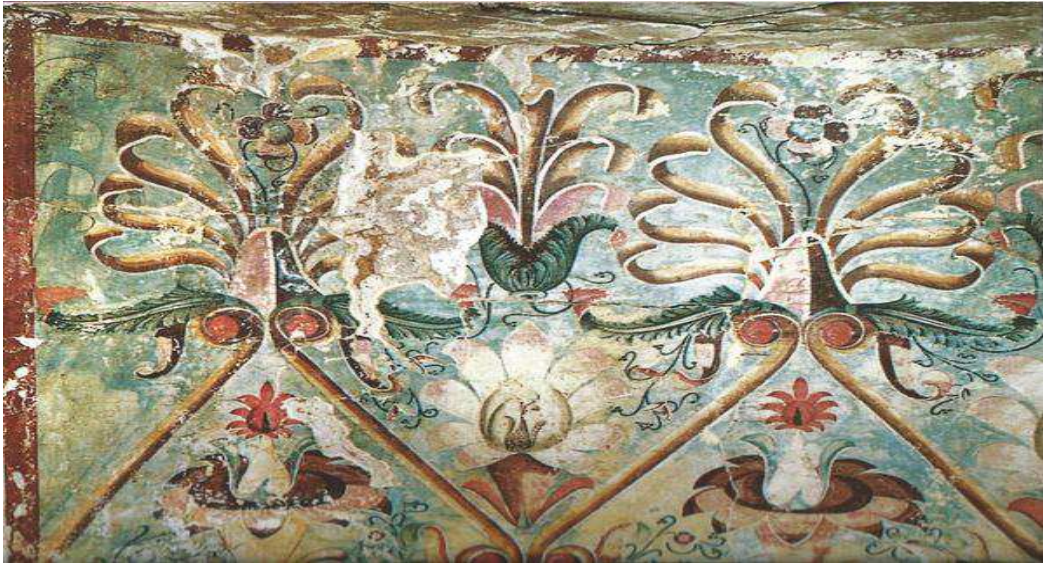
Dipinti della Tomba delle palmette

Trasferimento a Mieza , una delle principali città del regno macedone. Visita alle tombe dipinte di Lefkadia (Tomba delle Palmette e Tomba del Giudizio), tra le più famose della Macedonia.